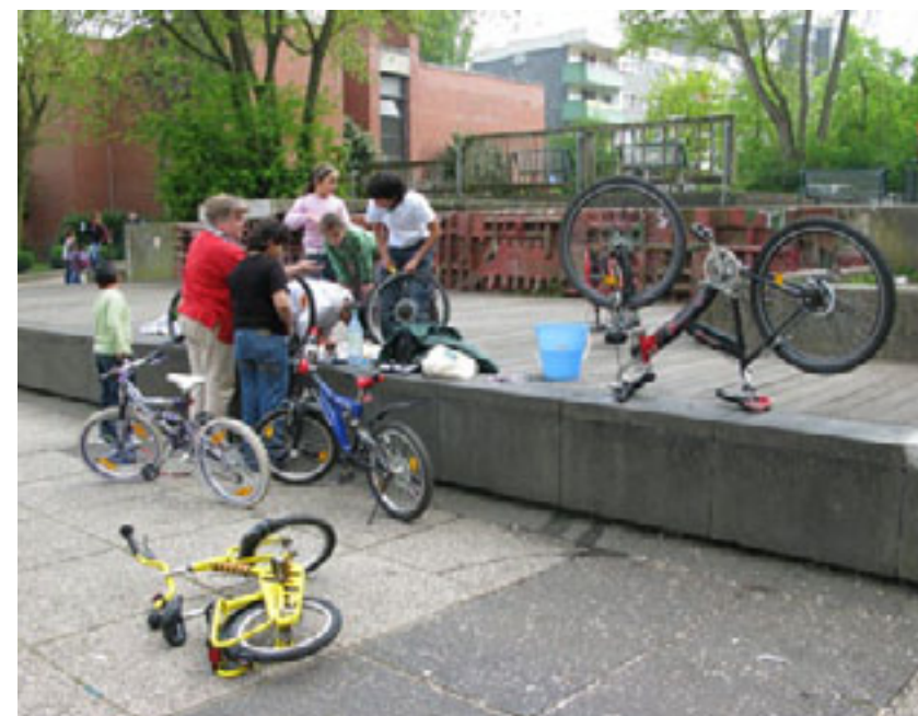
Workshop pentru reparații de biciclete Bicycle repair workshops

În 2008, am primit o invitație din partea primăriei orașului Bochum de a realiza un proiect de artă pentru Hustadt, cartierul suburban cu un început interesant și o istorie recentă turbulentă. Proiectul planificat să dureze nouă luni s-a transformat într-un proces de negocieri, discuții și acțiuni de-a lungul a trei ani. Comandat mai întâi de către municipalitatea orașului Bochum ca un proiect de artă publică convențională, a devenit apoi o inițiativă autoorganizată, cu sprijinul militanților locali (Aktionsteam), și a fost acceptat în cele din urmă în planul de regenerare urbană pentru „Innere Hustadt”, constituind o parte din „Stadtumbau West” - Programul de Regenerare Urbană pentru Hustadt, Bochum. Am realizat diferite activități pentru această zonă cu scopul de a testa amplasamentul, pentru a folosi rezultatele ca argumente în discuțiile politice și pentru a pune în practică în cele din urmă ideea noastră referitoare la Pavilionul Comunității - Brunnenplatz 1 - infrastructură multifuncțională pentru piața principală din Hustadt.