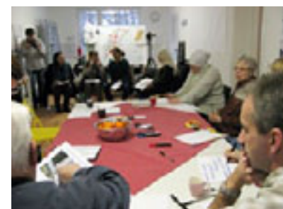
Workshop cu locuitorii din Hustadt, 01.2009

A community pavilion in Bochum, Germany becomes a platform for stimulating the imagination about the future of a suburban neighbourhood and its inhabitants.