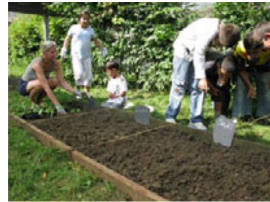
Grădinărit pe zona verde publică

Workshop with Hustadt inhabitants, 01.2009